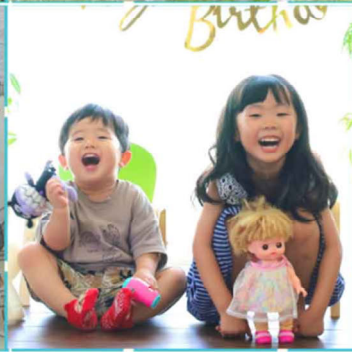
写真 お絵かき コンテスト